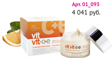
Арт. 01_093 4 041 руб.