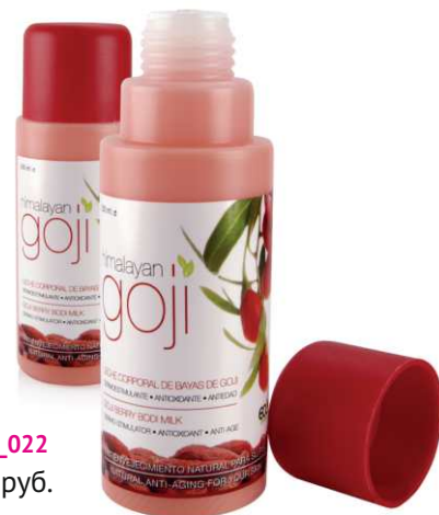
Арт. 01_022 1 443 руб.