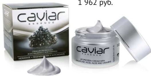
Арт. 01_051 1 962 руб.

Эффект шелковой кожи. Содержит гиалуроновую кислоту, мускатную розу, Алоэ Вера, таурин, кальций и витамины.