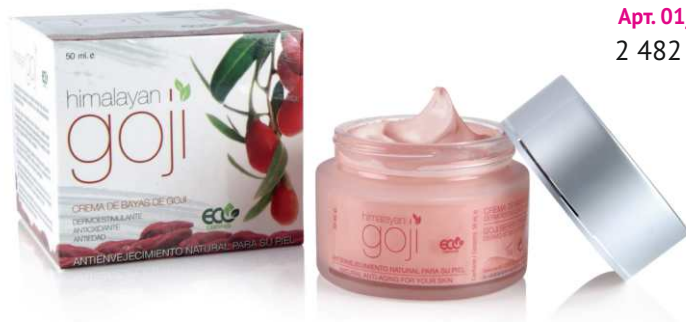
Арт. 01_021 2 482 руб.

Ягоды Годжи являются средством унисекс и идеально подходят для всех типов кожи как увлажняющий базовый дневной крем и ночной уход против старения и увядания. Рекомендован для зрелой кожи. Молочко применяется для тела в любое удобное время, особенно эффективно для использования после душа или ванны.